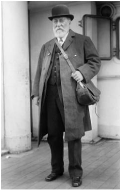
Camille St Saens (1835-1921)- France XIXème - Romantisme

extrait du « Carnaval des animaux » - 1886