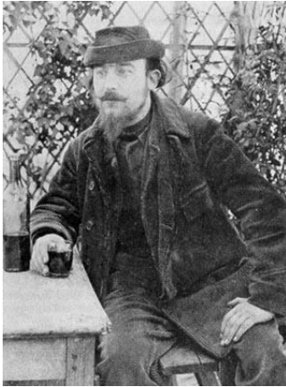
Erik Satie (1866-1925) - XIXe siècle - France Moderne et néoclassique